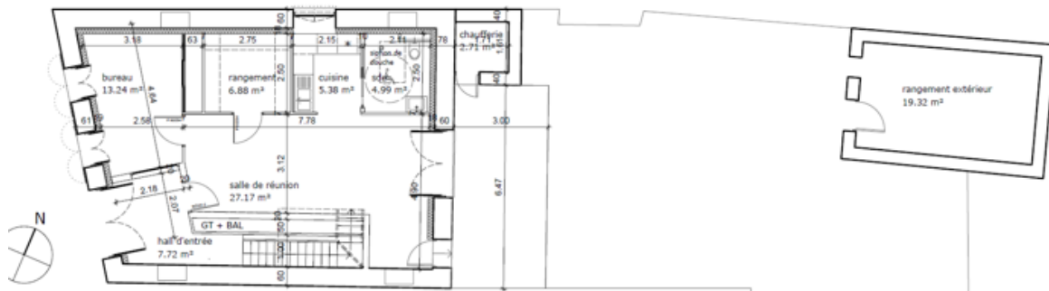
Plan Projet – RDC Hall – 7,72 m 2 Locaux ASSOCIATION – 60,37 m 2 Jardin Local extérieur 19,32 m 2