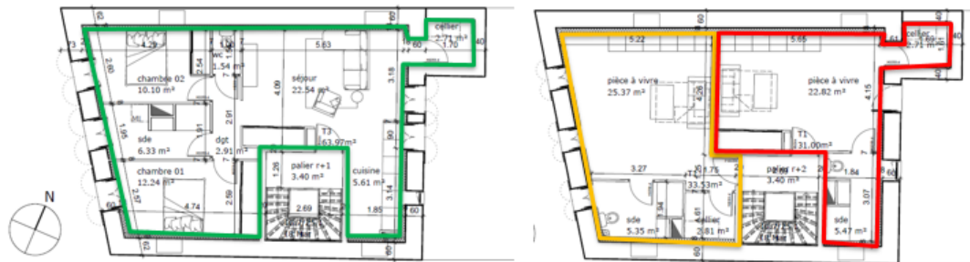
Plan PROJET – R+1 1 T3 – 63,97m 2