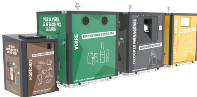
Futurs PAV avec colonnes aériennes