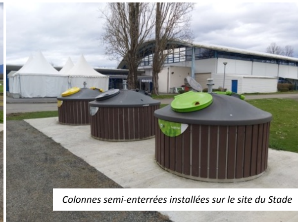
Colonnes semi-enterrées installées sur le site du Stade